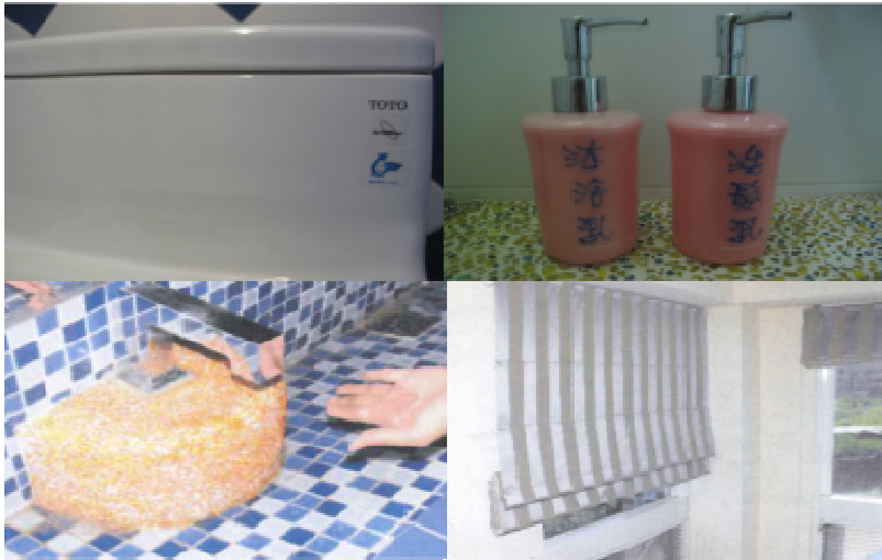
離島地區特優企業單位