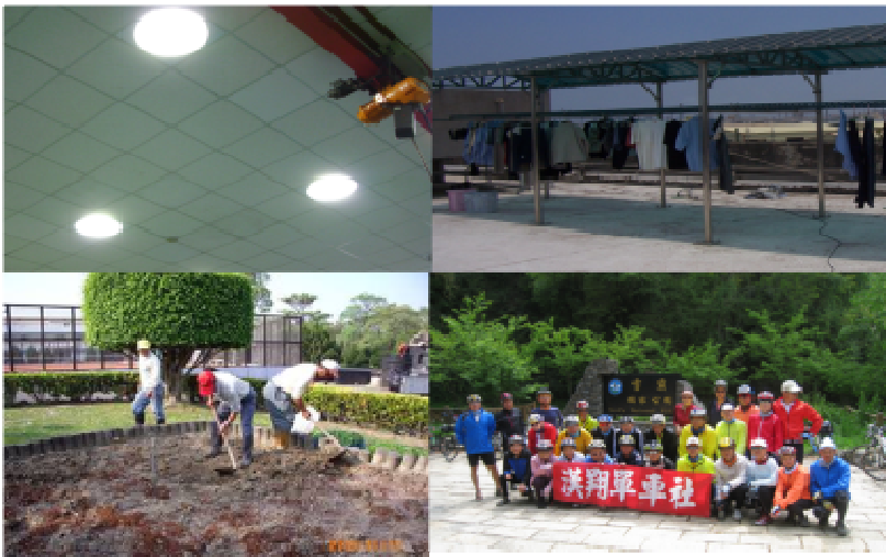
南區特優企業單位