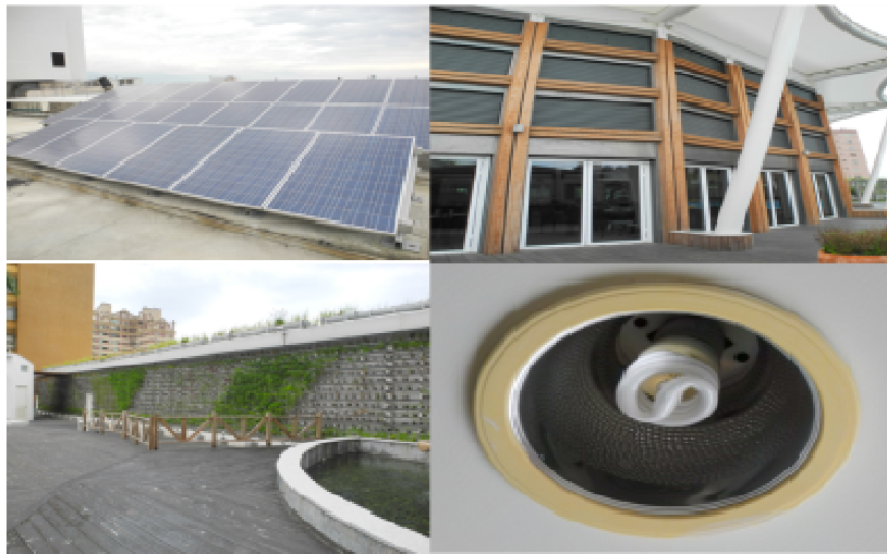
東區特優企業單位