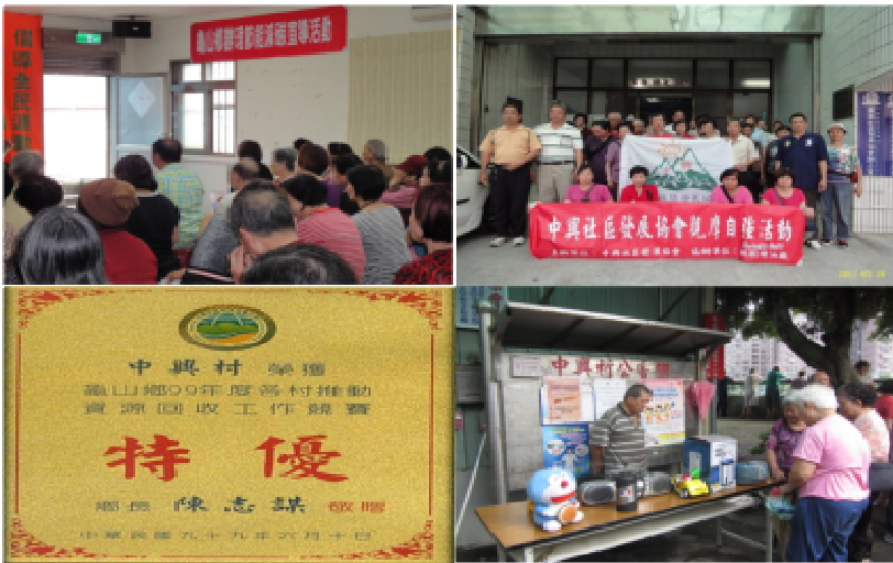
北部地區特優社區單位