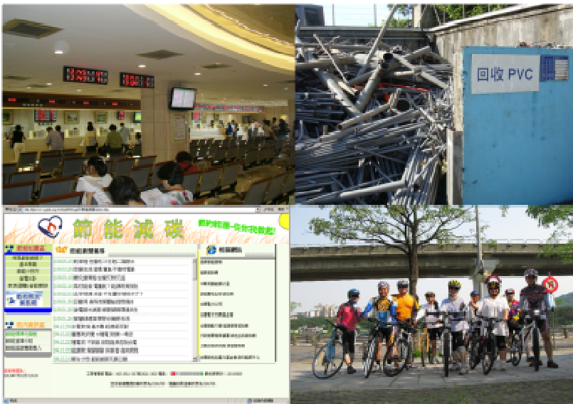
北部地區特優民間團體