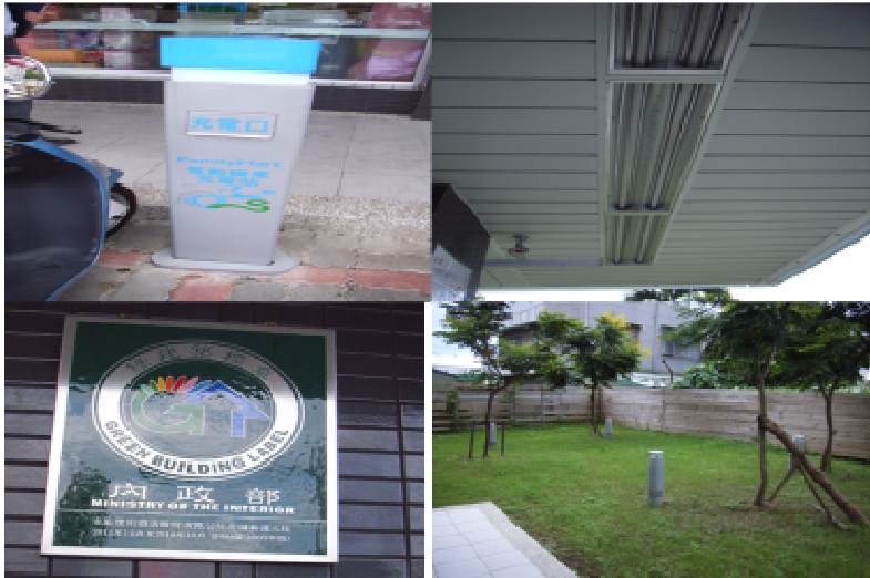
中區特優企業單位