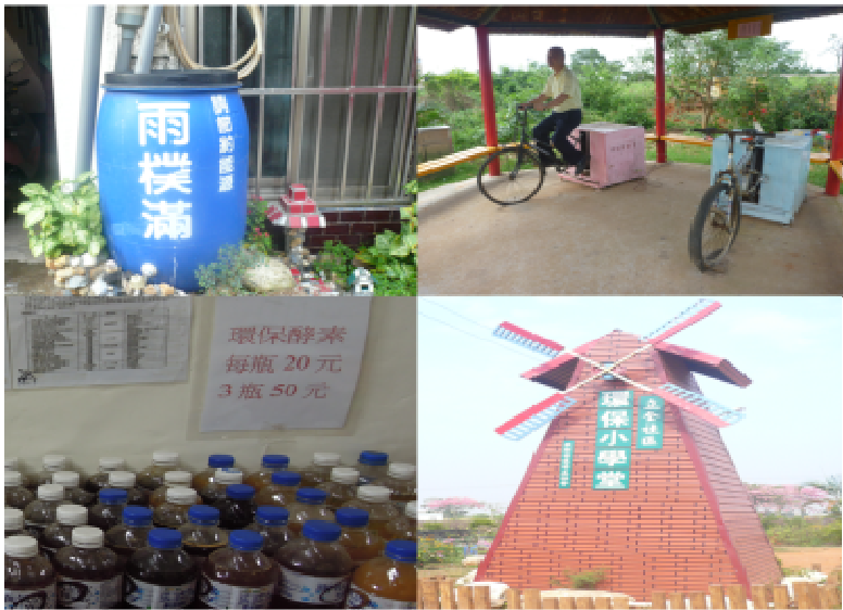
中部地區特優社區單位