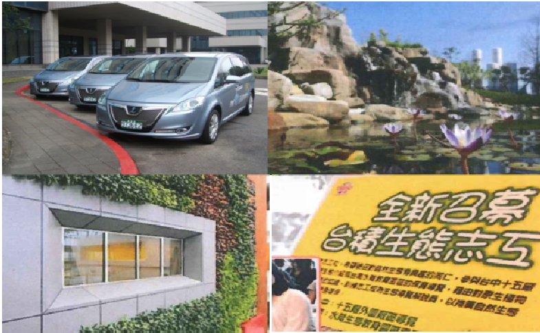
中區特優企業單位