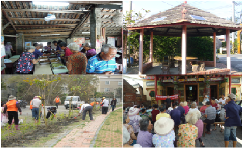
中部地區特優社區單位