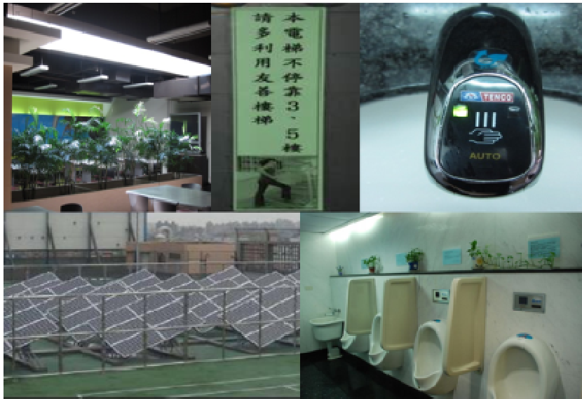
北區特優企業單位